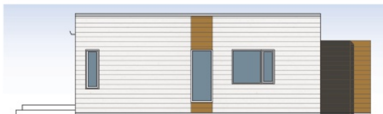
Fasad gavel 2 rok